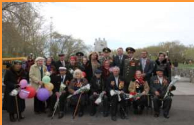
День Победы, 2013 год