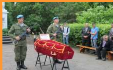
22 июня 2014 г., с. Таловское