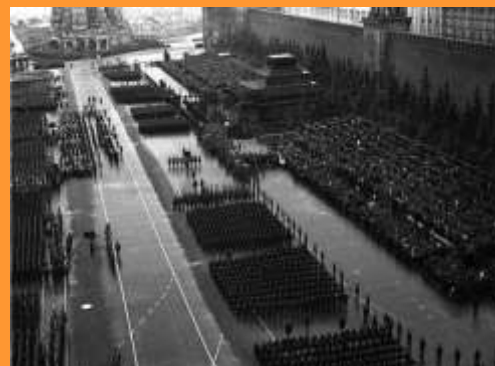
Парад Победы на Красной площади, 24.06.1945 г.