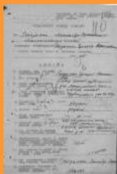
Запрос с фронта