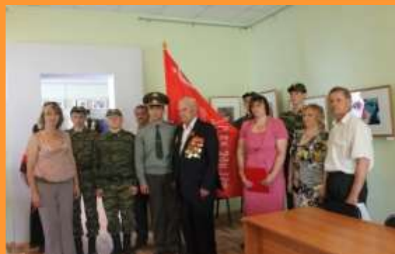
Музей, р. п. Шербакуль