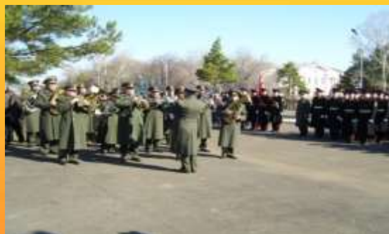
Омские кадеты на Шербакульской земле