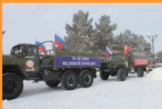
Автопробег «Патриот Отечества», 2015 год