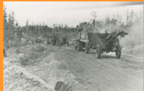
На Выборг, 1944 г.