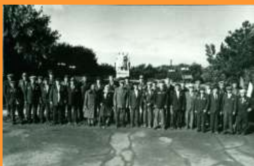
Ветераны Великой Отечественной войны, 1993 год