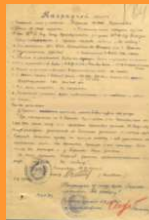
Наградной лист Ф. Королева