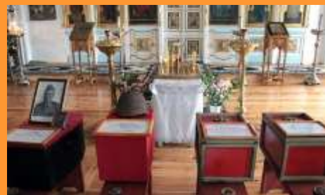
г. Вязьма, отпевание воинов