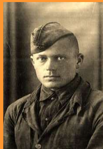
В. Голубь погиб 25.09.44 в Польше.