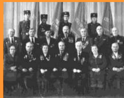
Ветераны Великой Отечественной войны