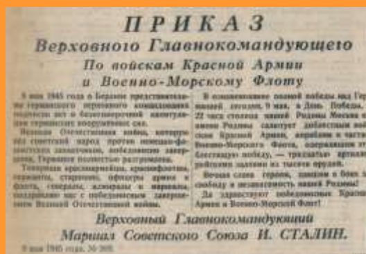
Приказ Верховного Главнокомандующего И. Сталина,

День Победы жители СССР праздновали 9 мая 1945 года!