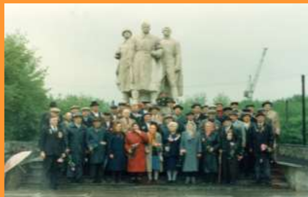
День Победы, 1997 год