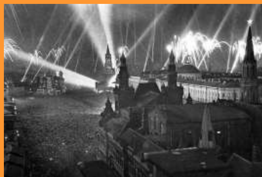
Салют в День победы, 1945 г.