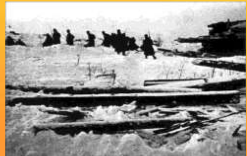
Начало битвы под Москвой, декабрь 1941 г.

В июне 1944 года части дивизии уже на Ленинградском фронте при поддержке Балтийского флота взяли город-крепость Выборг. За активные боевые действия 386-й, 693-й и 707-й стрелковые полки получили наименование Выборгские. На завершающем этапе войны дивизия принимала участие в ликвидации Курляндской группировки противника в Прибалтике, где и встретила Победу.