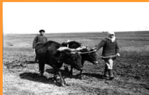
Фотография военного времени