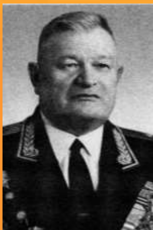
Г. Семенко, генерал Ленинградский фронт