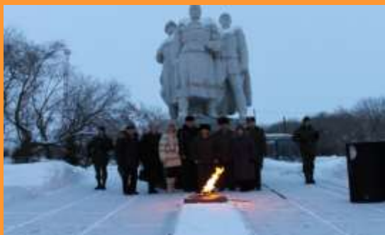
Митинг к 70-летию Сталинградской битвы, 2013 год