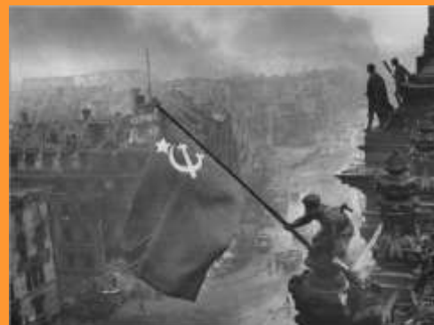
Флаг над Рейхстагом, 1945 г.