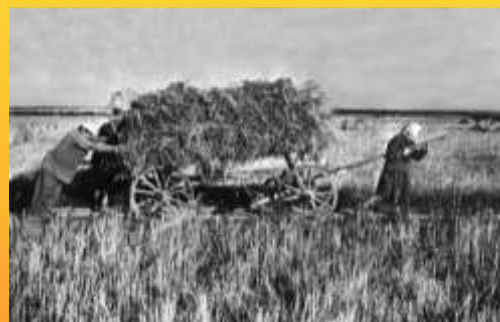
Фотография военного времени

«Подвиг земляков в годы Великой Отечественной войны, на фронте и в тылу, бессмертен и будет вечно жить в нашей памяти, в памяти потомков!»