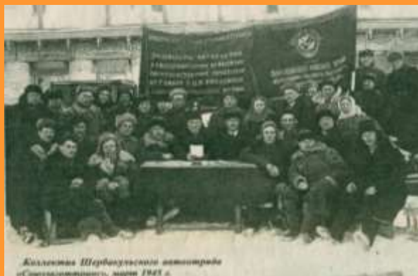
Коллектив Шербакульского автоотряда, 1945 г.

падеж скота, упали надои. Снизилась урожай. Но шербакульцы не пали духом, они продолжали трудиться на полях, фермах – делали все возможное и сверх возможное, работали для победы. В этот год был открыт Шербакульский маслозавод.