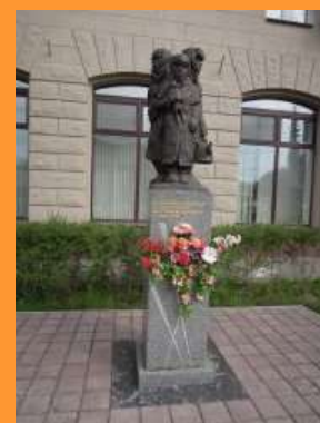
Памятник детям блокадного Ленинграда, установлен 21.02.2014 г. в г. Омск

После снятия блокады и окончания войны, большая часть детей вернулась в родной город. Но немало юных ленинградцев навсегда связали свою судьбу с нашим районом.