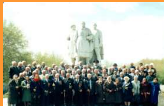
Ветераны Великой Отечественной войны, 1995 год