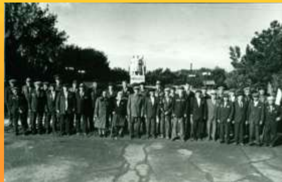
Ветераны Великой Отечественной войны, 1993 год

Идя в атаку, знали они, что товарищ всегда прикроет, что дело их правое и, что им нужна одна победа, одна на всех – они за ценой не посядут. Они выстояли, и мы чтим их!