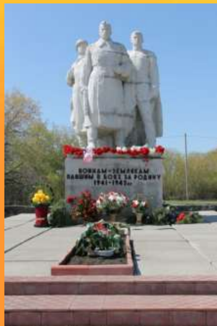
Памятник воинам – землякам, павшим в боях за Родину 1941 -1945 г.г.