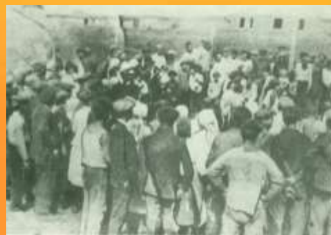
Митинг в Борисовском совхозе, 24.06.1941 г.

К райвоенкому ежедневно приходили десятки людей с просьбой отправить на фронт.