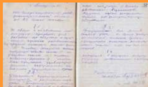
Выписка из приказа, 23.06.1941 г.